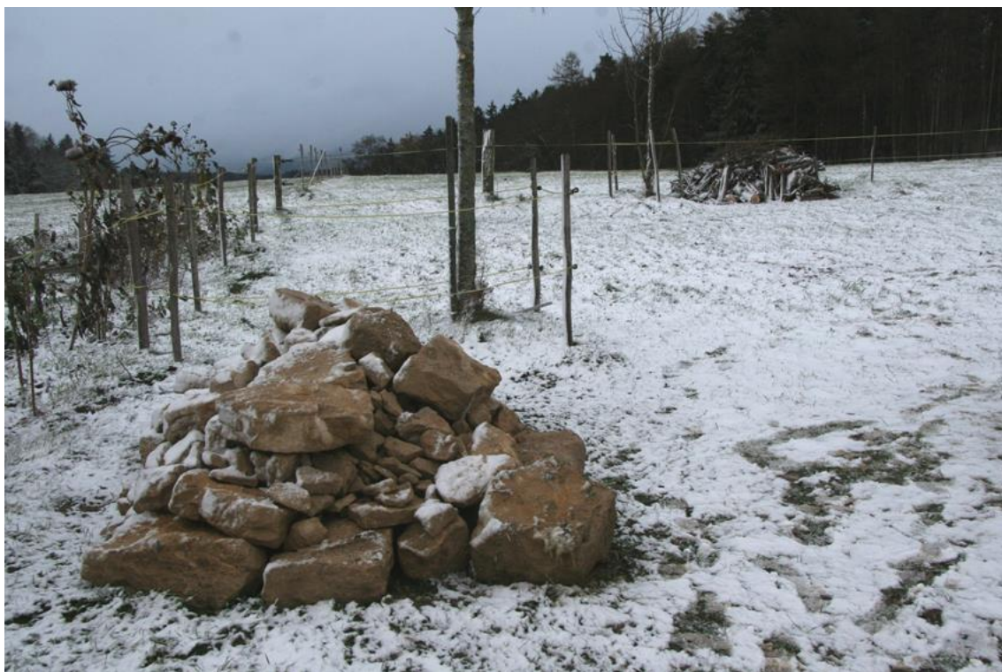
Buus neue Strukturen im Winter