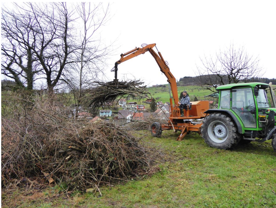
Nach der Handarbeit der Maschineneinsatz in Hemmiken

Im Jahr 2016 wurden in Maisprach, Buus und Hemmiken und Rothenfluh neue Strukturen angelegt.